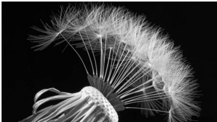
Die Schönheit liegt im Detail: „Löwenzahn“ von Jörn Lütjens.

Die Idee dahinter ist, dem „Kleine“ – oft nicht gesehen, übersehen oder unbeachtet – einen neuen Stellenwert zuzuordnen. Die elf Fotografinnen und Fotografen der Gruppe haben sich dabei mit ihren individuellen Ansichten und Herangehensweisen diesem Thema ganz unterschiedlich genährt.